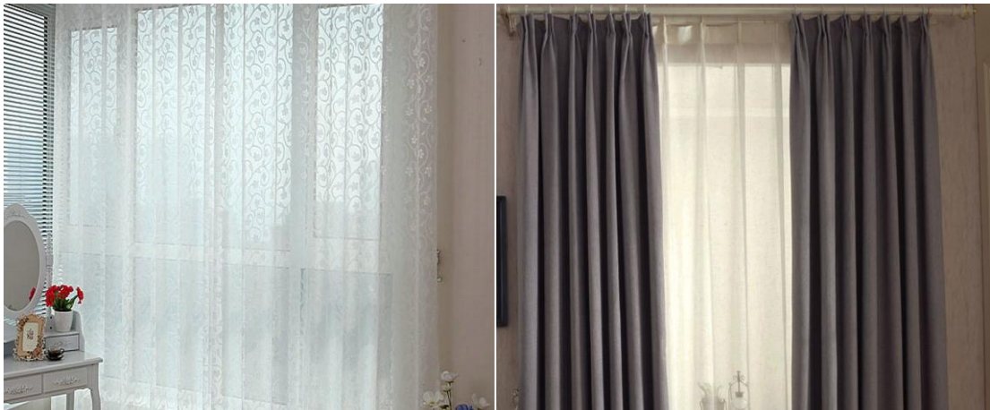
Gambar 1. Tirai (Termasuk Gordien), Kerai Dalam, Kelambu Tempat Tidur, dan Barang Perabot Lainnya

sedangkan tirai dilapisi dengan kain rajutan/kaitan yang ringan dan mengurangi intensitas cahaya luar yang masuk.