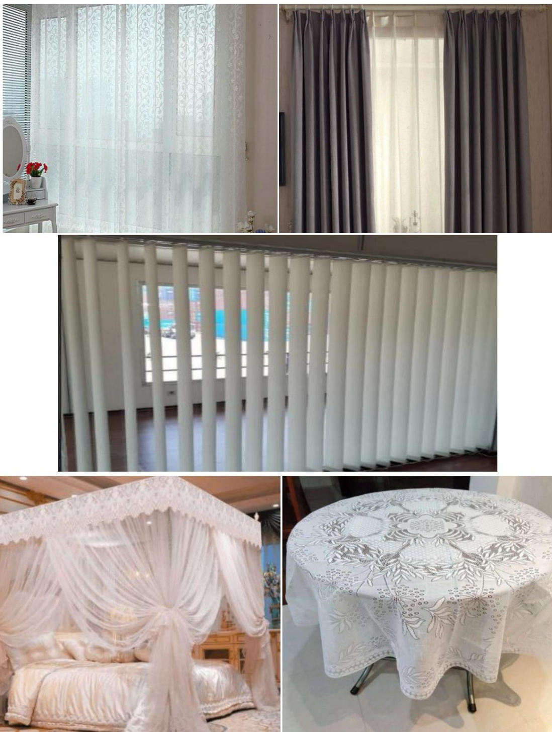
Figure 1. Curtains (Including Drapery), Blinds, Bed Nets, and Other Furnishings

while the curtains are lined with light knitted/hooked fabric and reduce the intensity of incoming outside light.